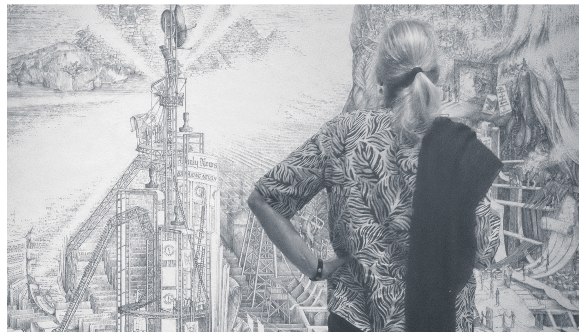
Een bezoeker bekijkt het werk van Kingma in het Rijksmuseum Twenthe.